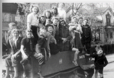
Bevrijding van Meppel

Door wie is jouw woonplaats bevrijd? Omcirkel het antwoord.