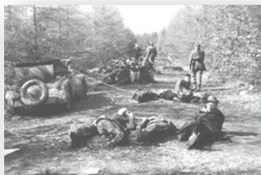
Parachutisten bij Gasselte

Zoek op internet op welke delen van Nederland in januari 1945 al bevrijd zijn. Kleur die delen in op de kaart hierboven.