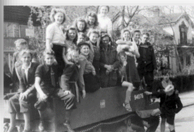
Bevrijding van Meppel

Door wie is jouw woonplaats bevrijd? Omcirkel het antwoord.