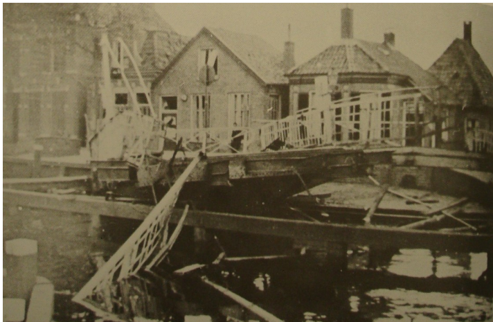
Oude Witterbrug Assen